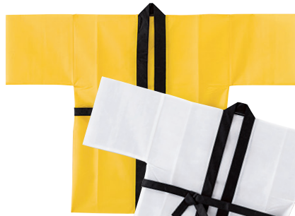
カラー不織布ハッピー