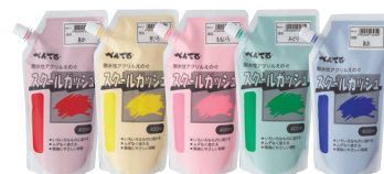
スクールガッシュ(400mL)