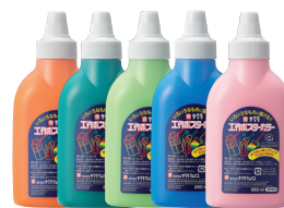
工作ポスターカラー