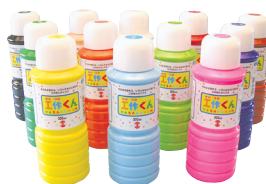
ターナー工作くん 300mL