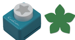
ミドルサイズ クラフトパンチ

軽量ねんど ※軽くて柔らかく、手触りもなめらかなねんどです。乾燥後は硬くなり、さらに軽くなります。