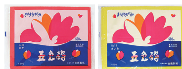
おはながみ<五色鶴>