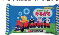
軽量かみねんど<かるがる>

軽量ねんど ※軽くて柔らかく、手触りもなめらかなねんどです。乾燥後は硬くなり、さらに軽くなります。