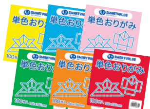
単色おりがみ(100枚入)