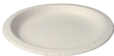
ナチュラルパルププレート