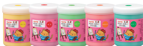
ポスターカラー〈クラス用I〉