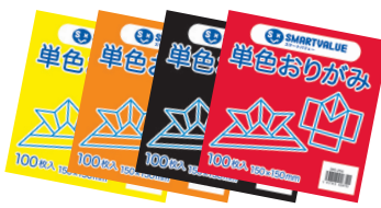
単色おりがみ(100枚入)