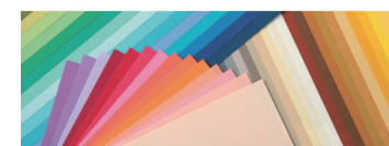
色画用紙 やよいカラー 4ツ切・8ツ切