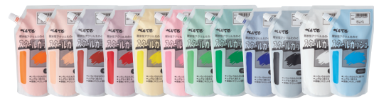
スクールガッシュ<全12色>