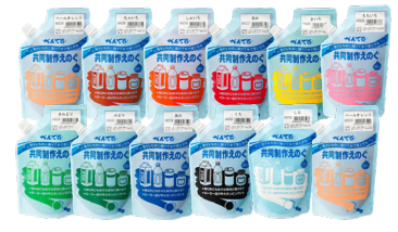
共同制作えのぐ<全12色>