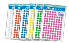
パリオシール ホログラム