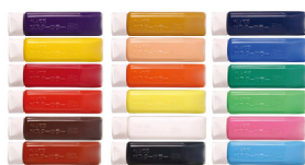
ポスターカラークラス用<全18色>