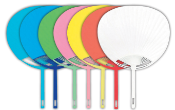
うちわ無地カラー(10本入)