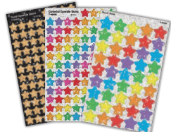
キラキラごほうびシール