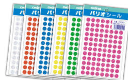
パリオシール ホログラム