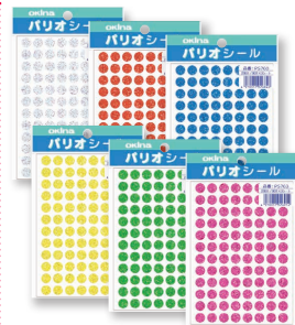
パリオシールホログラム