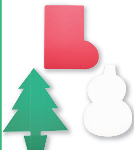
型抜き色画用紙 楽々キット(冬)