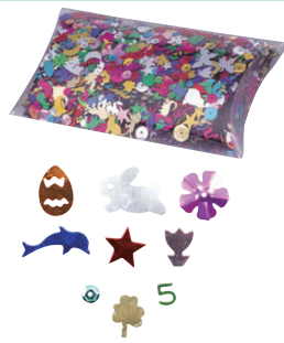
スパンコールミックス