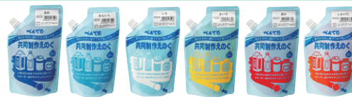
共同制作えのぐ(全12色)