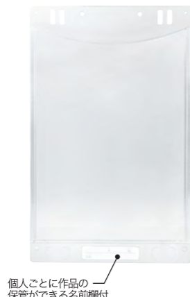
個人ごとに作品の保管ができる名前欄付